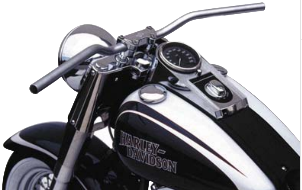
Speedfighter MCL 125

Mit ABE! Kein TÜV nötig! TÜV approved! TÜV homologué !