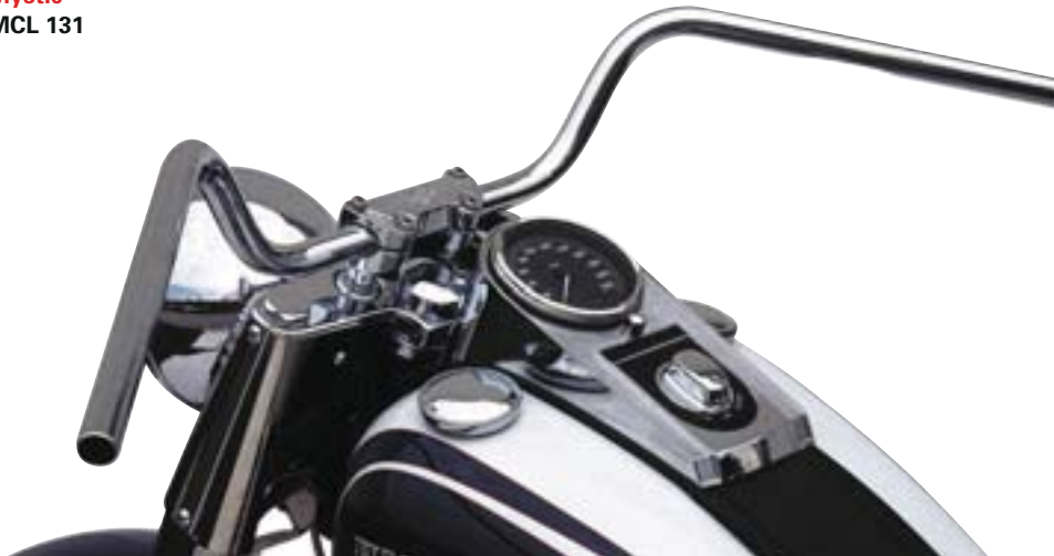
Mystic MCL 131